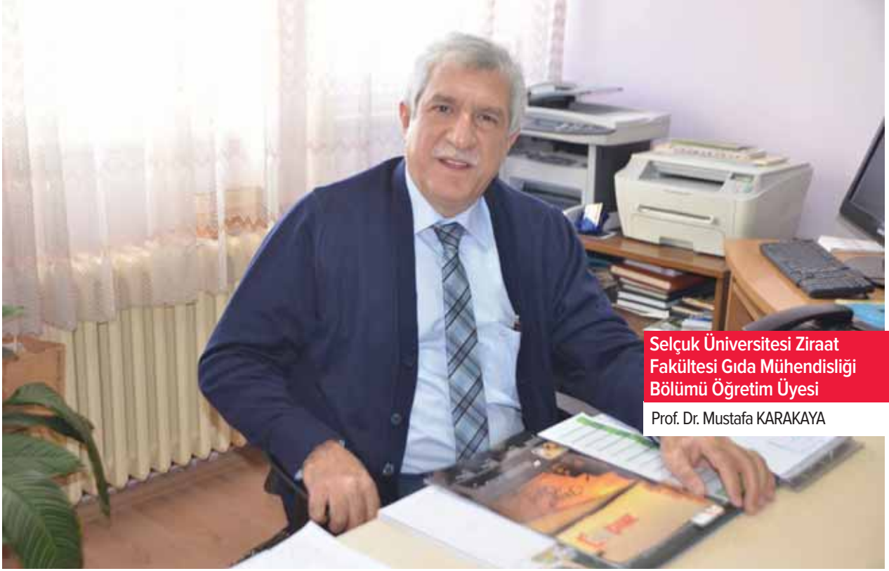
Selçuk Üniversitesi Ziraat Fakültesi Gıda Mühendisliği Bölümü Öğretim Üyesi