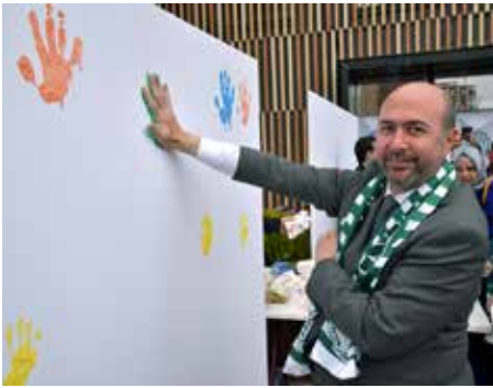
“SOBE En Büyük Değerimiz”

Selçuklu Otizmli Bireyler Eğitim Vakfı'nın (SOBE) iki yılı aşkın bir süredir otizmli çocuklara yönelik faaliyetlerini sürdürdüğünü ifade eden Selçuklu Belediye Başkanı Ahmet Pekyatırmacı, “Biz burada artık mezun vermeye ve neticeler almaya başladık. Özellikle küçük yaşlardaki çocuklarımız buraya geldikleri zaman çok olumlu neticeler alınıyor. Merkezimizde bir taraftan eğitim ve rehabilitasyon faaliyetleri devam ederken bir taraftan da bizim otizmle ilgili farkındalığı arttırmamız gerekiyor. Bunu yaparken hem ailelerimizin otizmle ilgili bilgi sahibi olmasını sağlamalı hem de burada yürütülen faaliyetlere Konyalı hemşehrilerimizin desteğinde bulunması için farkındalığı arttırmamız gerekiyor. Selçuklu Belediyesi olarak önümüzdeki süreçte bununla ilgili çok ciddi faaliyetler yürüteceğiz. Sadece merkezimizde değil merkezimiz dışında da çok sayıda faaliyetler yürüterek SOBE'nin desteklenmesi ve daha kurumsal bir şekilde buradaki faaliyetlerini devam ettirebilmesi için elimizden gelen çalışmaları hep birlikte yapacağız.