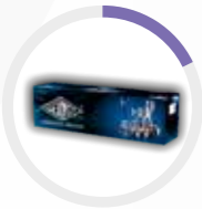
Ofset Baskılı Kutu