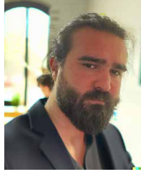
GÖKTÜRK KOCAŞ ELEKTRİK ELEKTRONİK YÜKSEK MÜHENDİSİ

Bir de Turing Testi diye bir olgu var ki, aslında yapay zekanın "gerçekten zeki" olup olmadığını belirler. Turing Testi, bir robotun bir insan kadar ikna edici olup olmadığını ölçer. Test basitçe şu şekilde yapılır: Bir insan hakem, bir dizi soru sorar ve aldığı yanıtlara